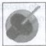
Mine niveau 2